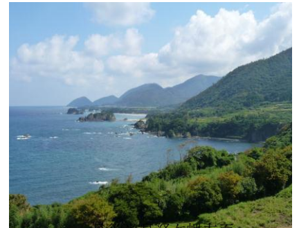
丹後半島経ヶ岬方面

この保健所だよりにも掲載させていただいておりますが、様々な相談窓口を設置しておりますので、どうぞお気軽にご利用ください。これからも府民の皆さんにとって身近な保健所を目指して、激変する社会・環境情勢にも対応しながら、職員が一丸となって取り組みを進めてまいりますのでどうぞよろしくお願ひします。