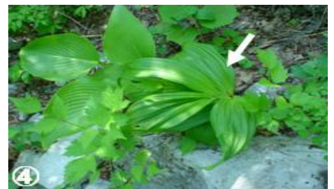
【バイケイソウ(矢印)とオオバギボウシの混在の様子】