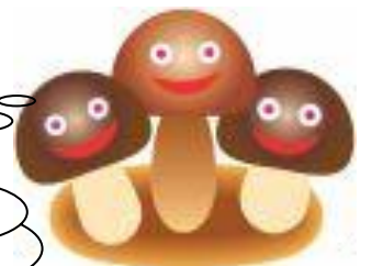
担当 環境衛生室 (0772-62-1361)