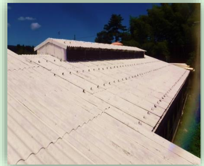
畜舎屋根へ石灰塗布することで直射日光の影響が緩和されます