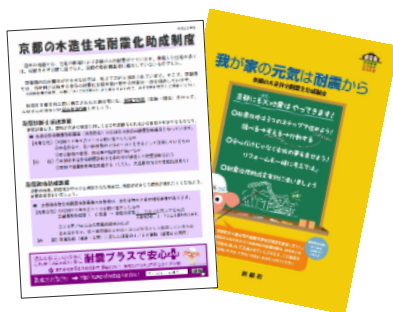
チラシ 近隣の方へのごあいさつに 必要なチラシを提供します。