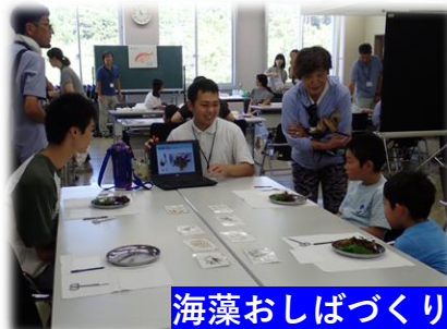
海藻おしばづくり