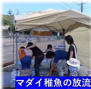
マダイ稚魚の放流