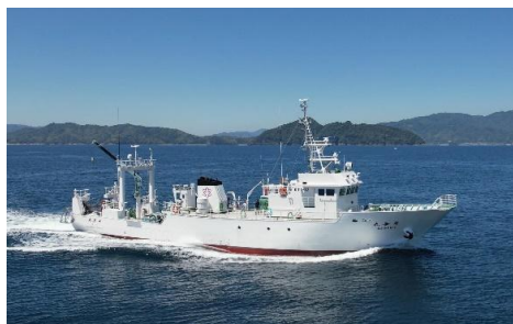
海洋調査船「平安丸」

各体験メニューとも複数回実施する予定ですが、参加希望者が一定数を越えた場合には参加をお断りする場合がございますので、御了承願います。