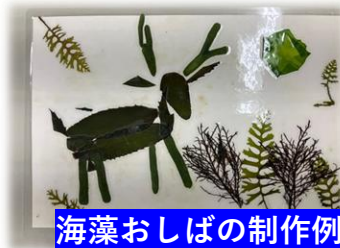
海藻おしばの制作例