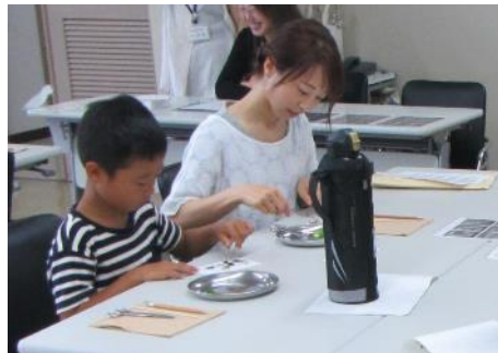
「海藻おしば」づくり