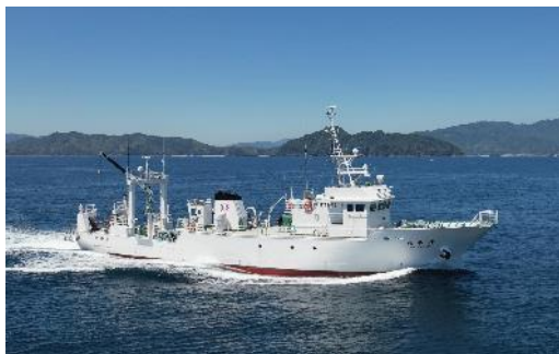
海洋調査船「平安丸」

各体験メニューとも複数回実施する予定ですが、参加希望者が一定数を超えた場合には参加をお断りする場合がございますので、ご了承ください。