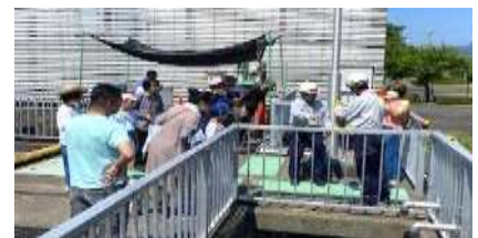
昨年の様子（施設見学）

取材を希望される方は、9時15分までに宮津湾浄化センター事務所（管理棟1階）までお越し下さい。※駐車場あり