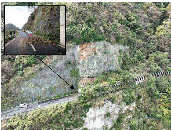
【崩落発生時の状況(令和5年11月14日)】