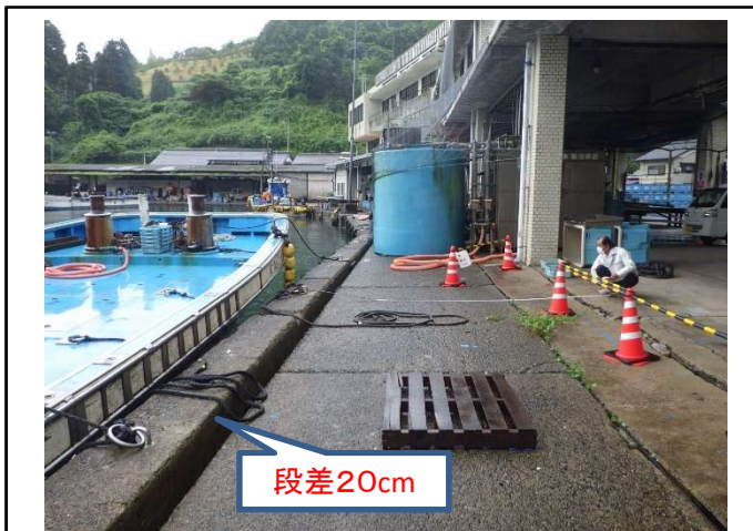
大浦第1岸壁 老朽化状況