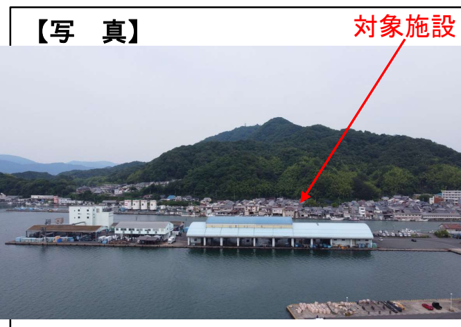
②高度衛生管理対策 卸売市場