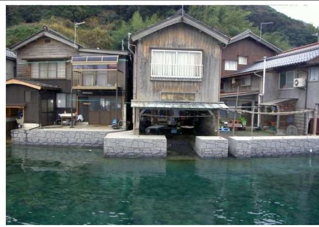
護岸整備後イメージ