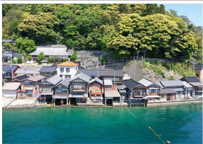
6年度施工予定箇所