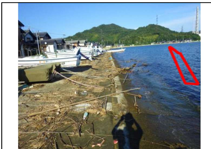
R 6 整備予定箇所