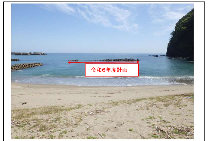
海岸保全施設 離岸堤