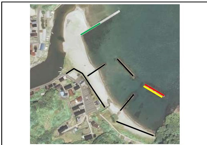
浦島漁港海岸 全景