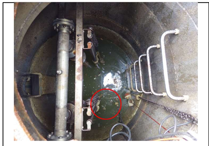
本庄漁港 中継ポンプ