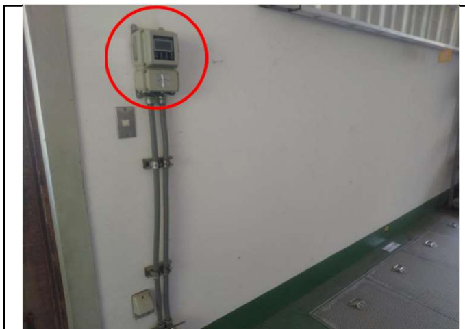
浦島漁港 処理場電気設備