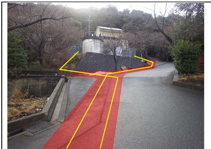
伊根地区飲雑用水(舗装本復旧)