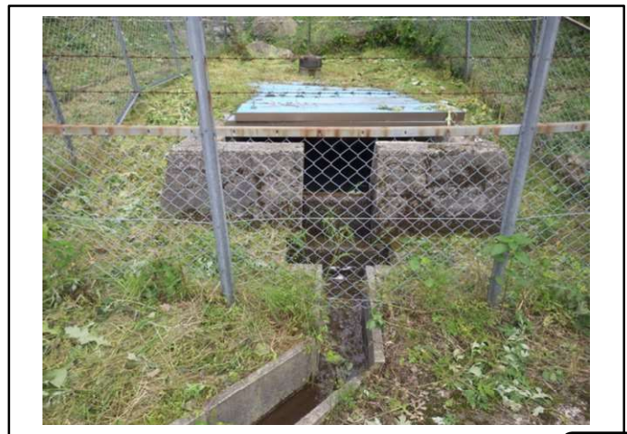
本庄地区取水施設