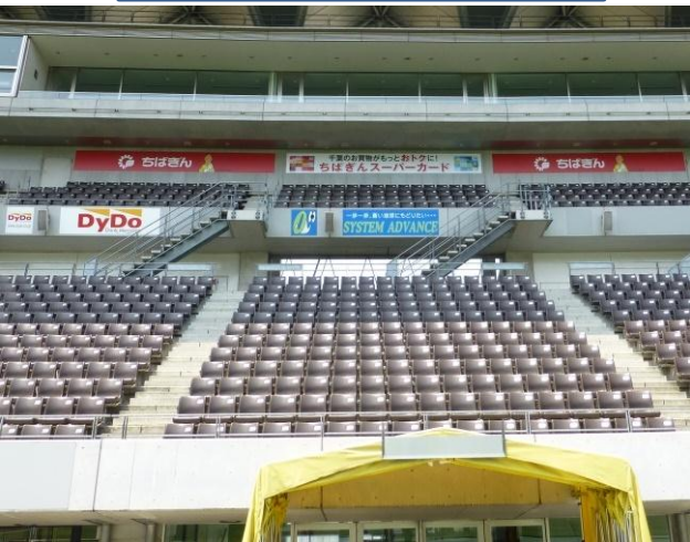
(フクダ電子アリーナ)