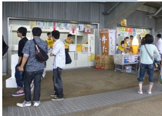
(ユアテックスタジアム仙台)