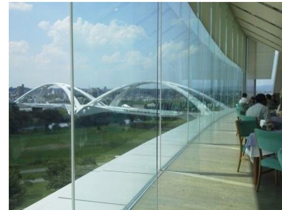
展望レストラン（豊田スタジアム）