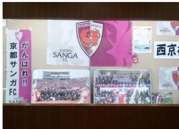
クラブショップ・ミュージアム イメージ