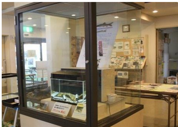
アユモドキ 展示イメージ