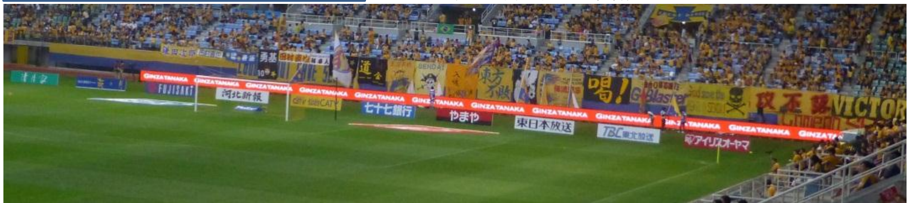
(ユアテックスタジアム仙台)