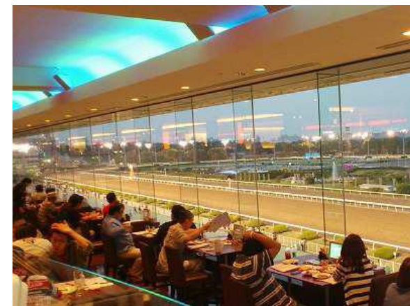
展望レストラン イメージ