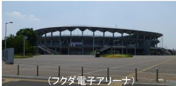
(フクダ電子アリーナ)

スタジアムは天然芝を良好に維持管理するために、Jリーグが使用する14箇所の専用球技場では、年間の平均利用日数が50日程度(うちJリーグは20試合程度)となっており、試合がない日は、利用者が少ない状況が見受けられる。