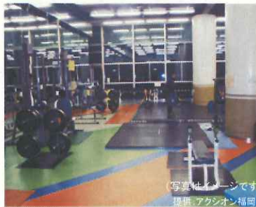
ウェイトトレーニング室