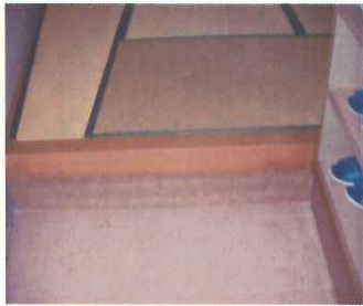
宿泊室入口の段差