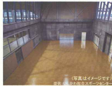
多目的スペースとしても活用可