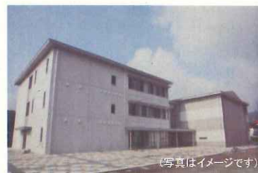
応援部隊の宿泊(新トレーニング・宿泊施設)