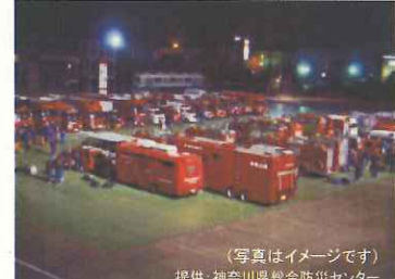
24時間の防災活動スペース