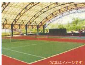
テニスコート屋根設置