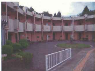
宿泊機能だけの施設