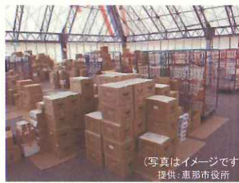
支援物資等の保管場所