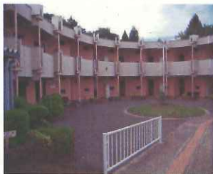
備蓄倉庫(現宿泊施設)