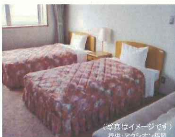
(写真はイメージです)