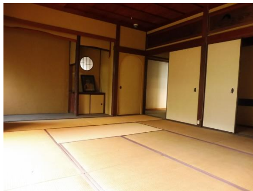
▲ 主屋・画室の様子