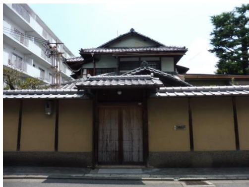
▲ 室町通から建物玄関を撮影