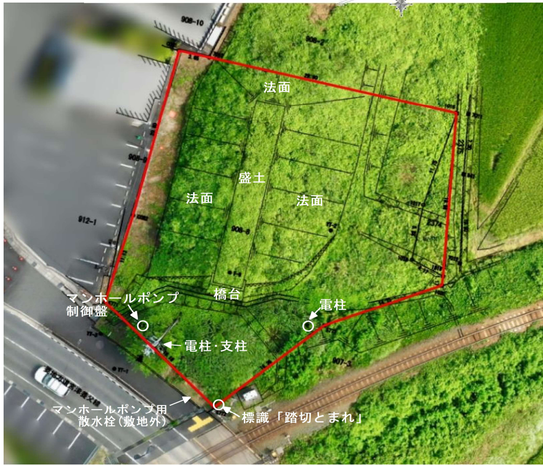
(当図は、空撮画像に、地積測量図を重ねたものであり、その位置及び縮尺については若干のズレが生じている可能性があります。)