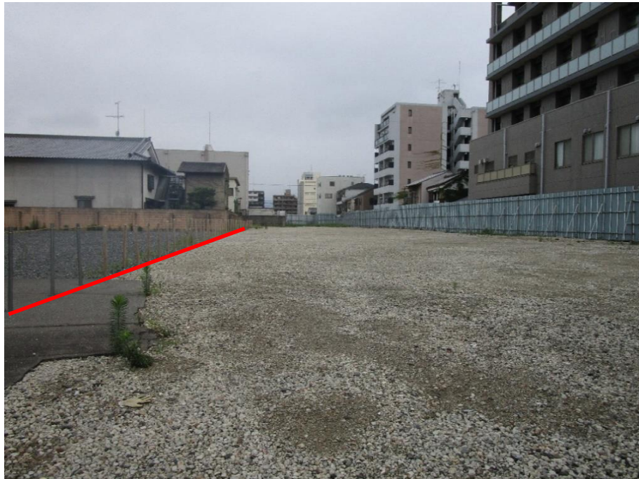
物件地内東側より撮影