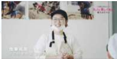
舞鶴佐波賀だいこんの授業（小学校）

きょうと食いく先生の授業の様子や、関係者へのインタビュー動画をYouTubeに掲載しています。