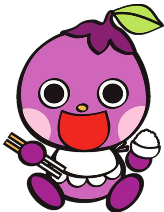
きょうと食育ネットワークマスコット なす坊