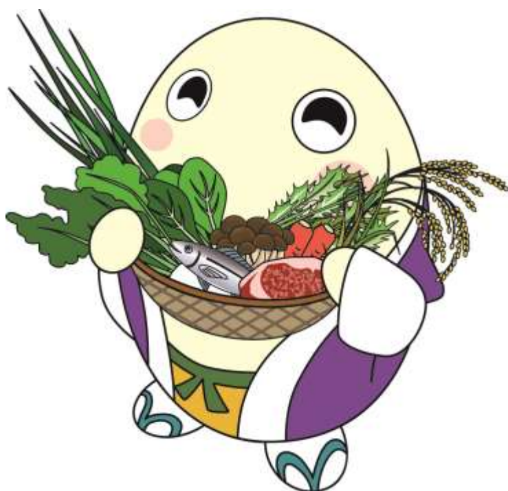
京都府広報監 まゆまる