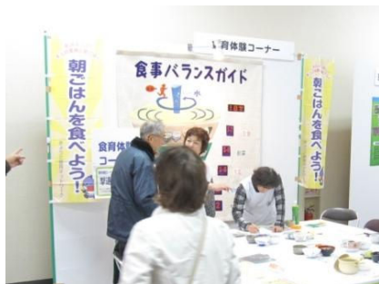
農林水産フェスティバル

「朝ごはんを食べよう」を統一テーマとして取組を推進 (農林水産フェスティバル、きょうと食育キャンペーン、府庁ロビー等での啓発展示 など)