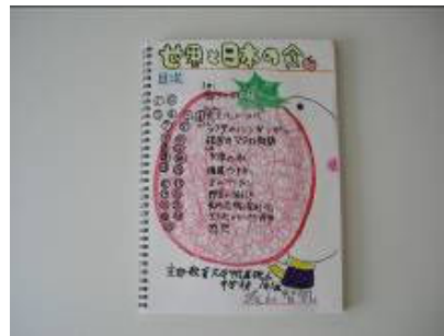
京都府町村会会長賞