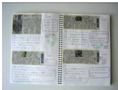
京都府農業協同組合中央会会長賞