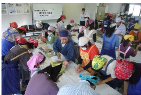
京の匠に学ぼう！親子手作り教室