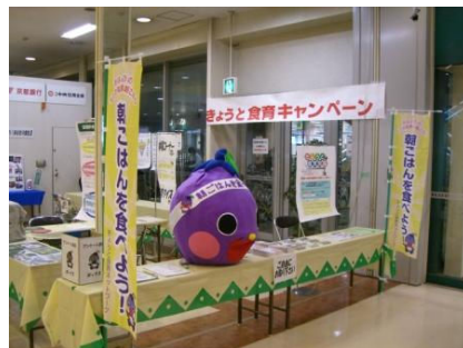
食育キャンペーン