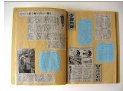
京都府栄養士会会長賞