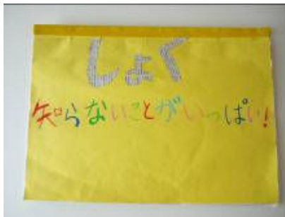
京都府市長会会長賞