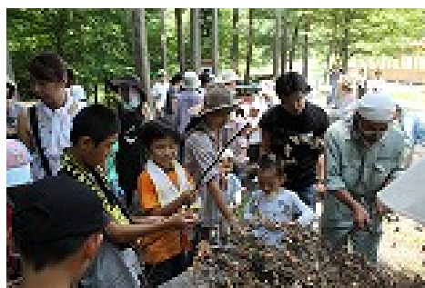
食育企画「森のめぐみを体験しよう」