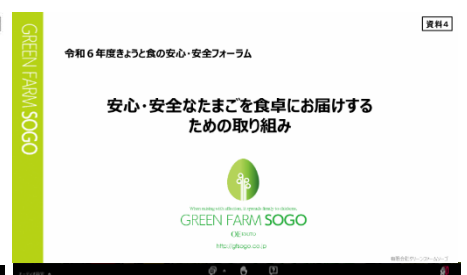
会場及び配信の様子