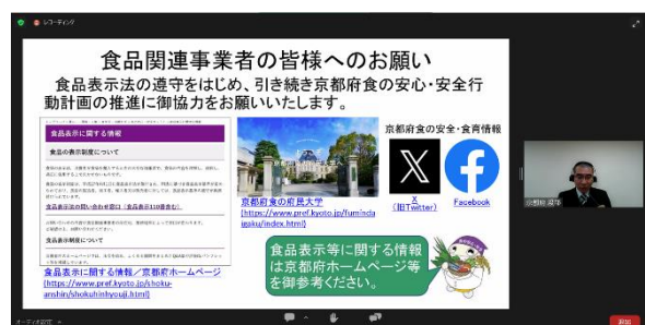
配信画面（左：食品表示研修（FAMIC）、右：専門研修（京都府））