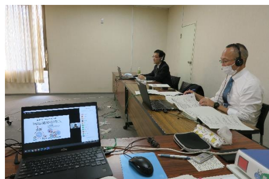
オンライン配信の様子