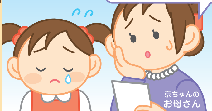
京ちゃんのお母さん