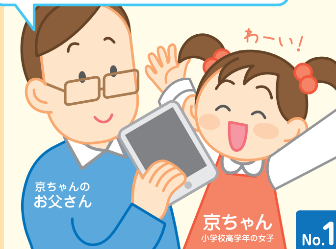
京ちゃんのお父さん