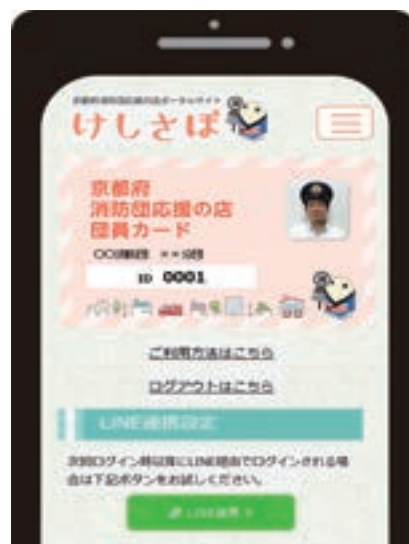
【「団員カード」ページ】