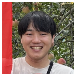
まさかずさん インフルエンサー (山陰北近畿魅力発信)