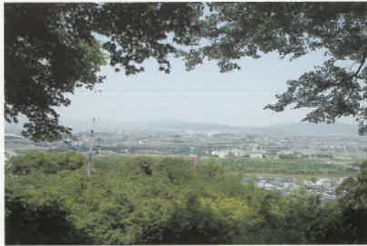
展望台からの遠望