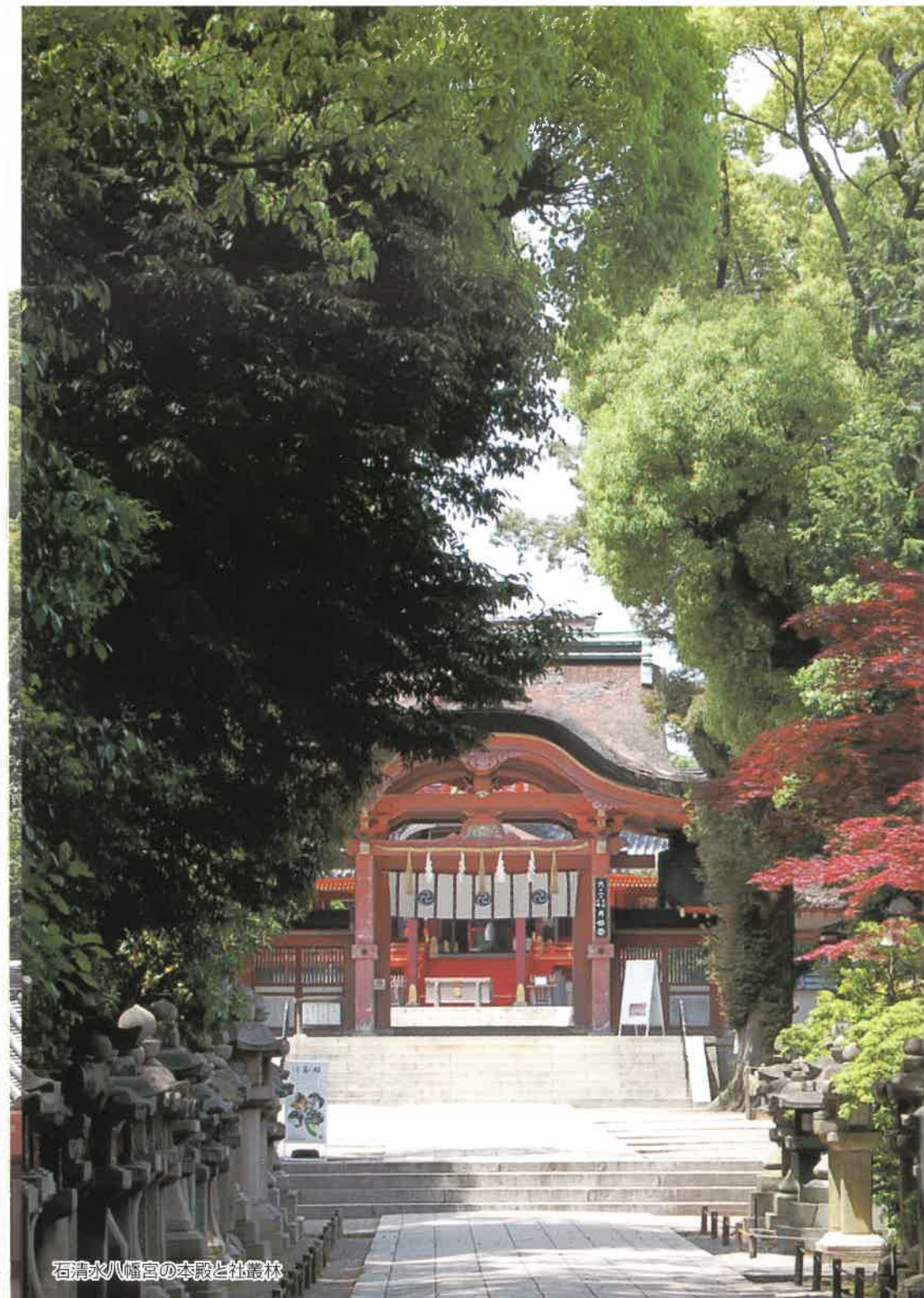
石清水八幡宮の本殿と社叢林