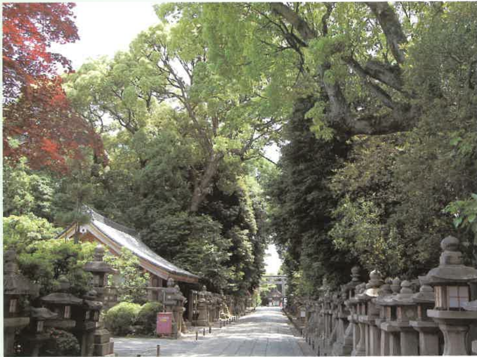
石清水八幡宮参道