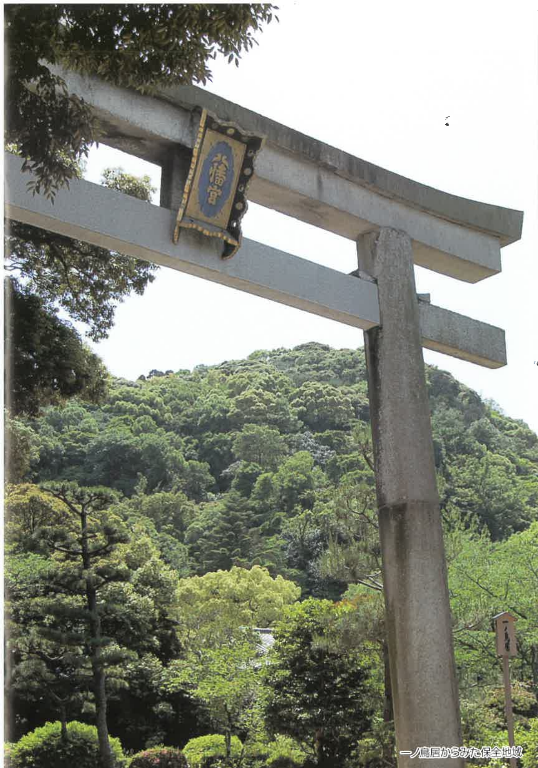
一ノ鳥居からみた保全地域