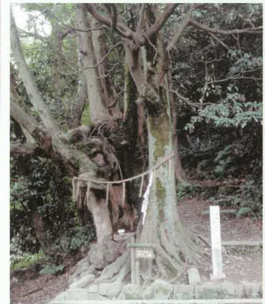
高良神社のタブノキ