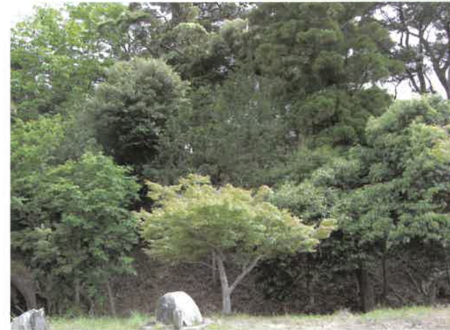
吉原山城三の丸跡

この山は、これらの歴史的な背景の中で生まれ、自然が保持されてきました。二の丸跡からは日本海が望め、市民の憩いの森として、手軽なハイキングコースとして親しまれています。