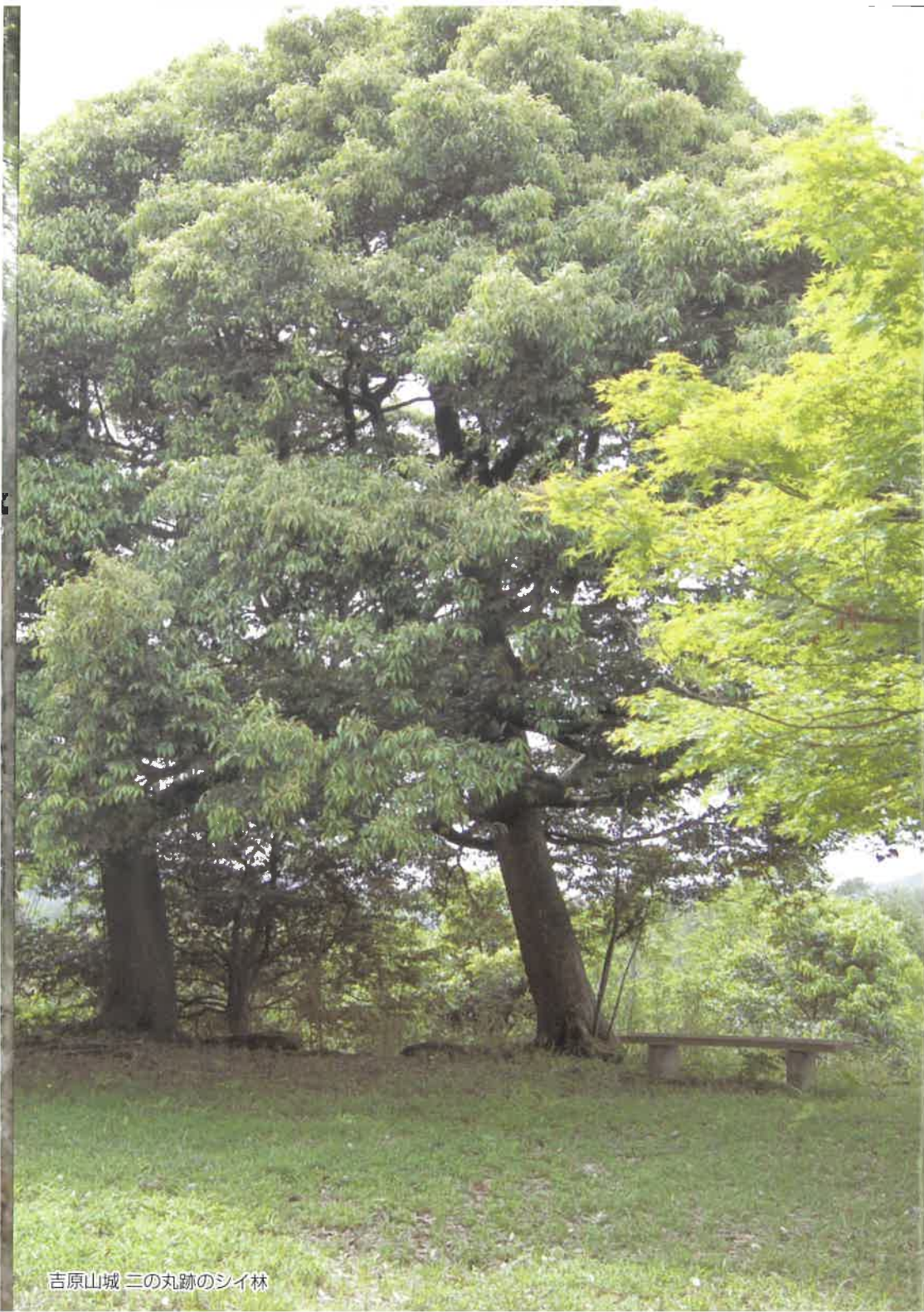
吉原山城 三の丸跡のシイ林