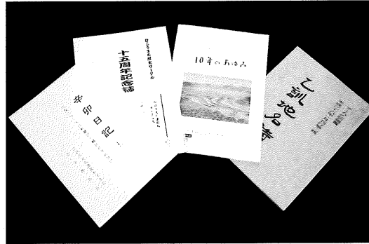
発表4団体による刊行物