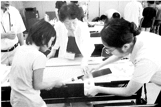
日頃の活動の様子