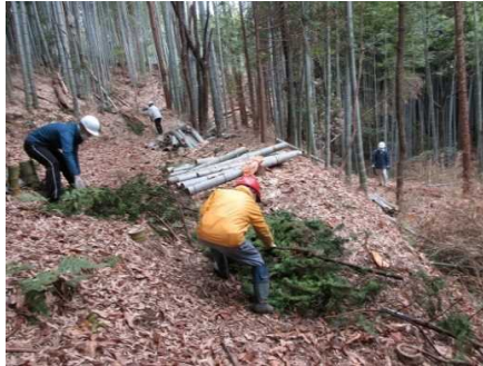
保全活動支援（京都市）