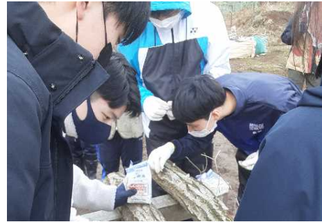
里山学習支援（宮津市）