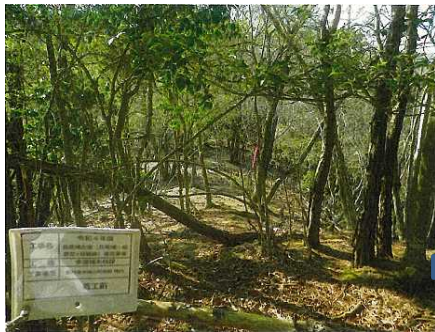
長尾城跡古道の森復活（実施前）