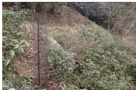
漆パイロット園地整備（福岡山市）