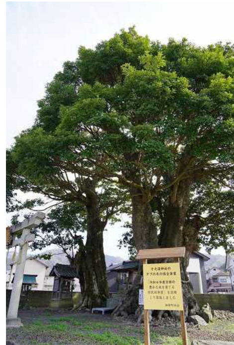
オノ道神社タブノキの蘇生（舞鶴市）