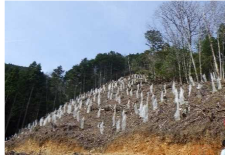
モデル林造成（綾部市）