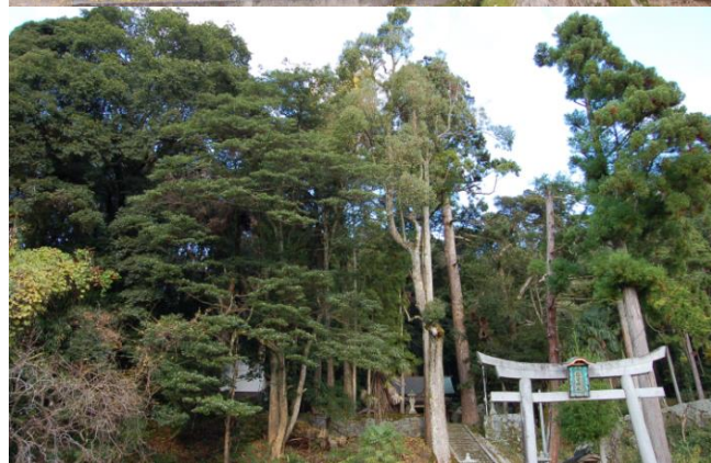
鍵守神社の社叢林