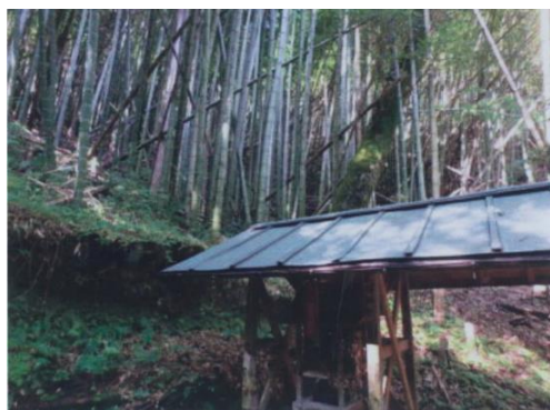
大川神社の竹林整備 施工前