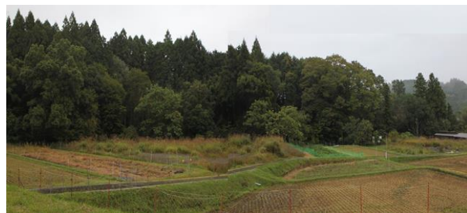
古道遠景(林の裾に沿って)