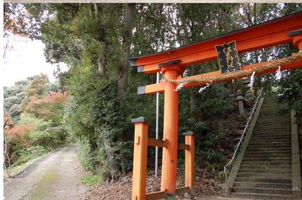
佐牙神社社殿と社叢林