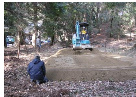
次世代苗木ほ場整備