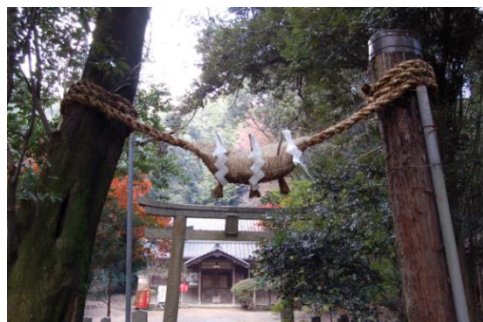
旦椋神社本殿と社叢林