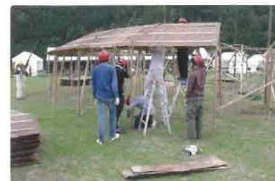
木製品の開発支援