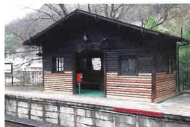
民間施設での木材利用