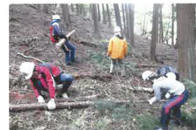
府民協働の森づくり