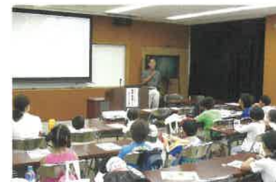
子供向け森林セミナー