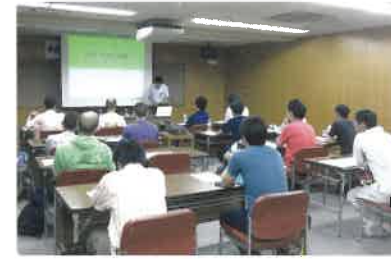
森林ボランティア講習会