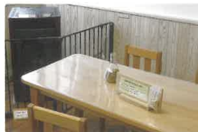
府民利用施設の木造化・木質化