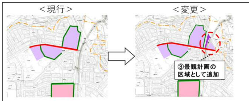
図3：平城・相楽地区（木津川市）景観計画対象区域