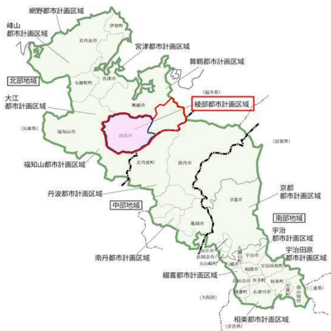
■京都府の都市計画区域の指定状況