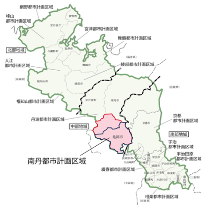
■京都府の都市計画区域の指定状況