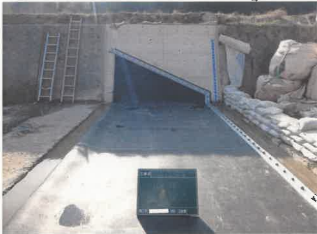
ゴム袋体 据付完了