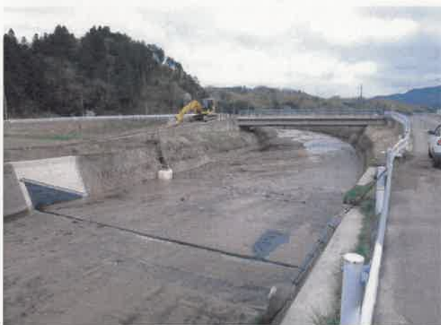
ゴム袋体 据付完了