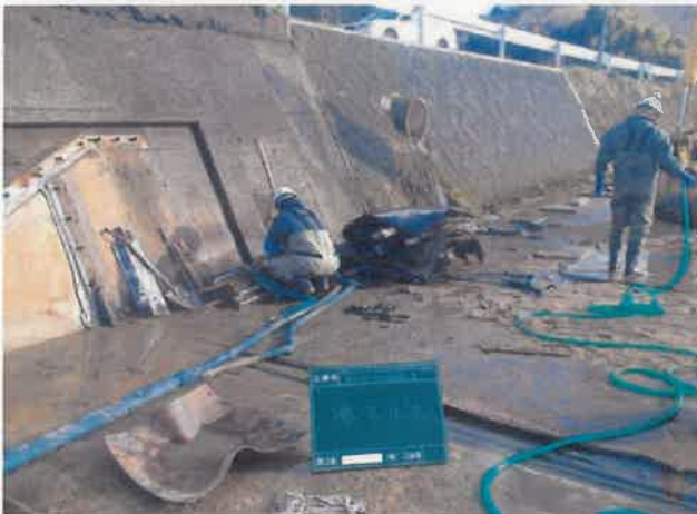
左岸側 既設ゴム堰撤去状況