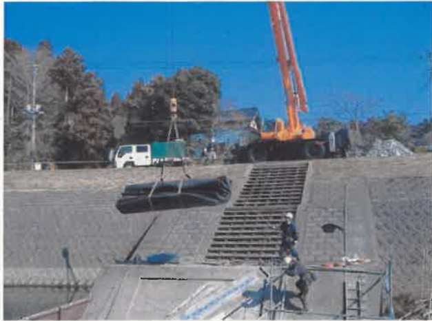
ゴム袋体 河川内吊り込み状況 ※本写真のみ別工事のもの