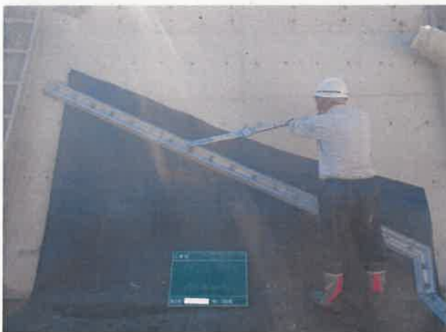
ゴム袋体 据付状況 押金具取付 締付