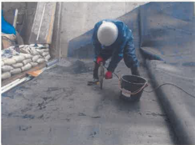
ゴム袋体 据付状況 現場穴明け