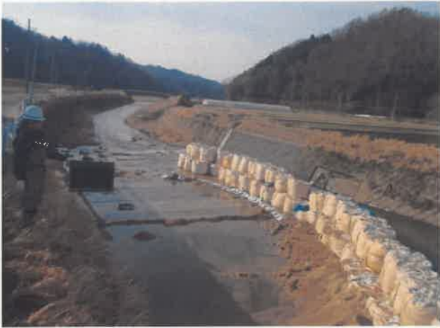
左岸側 既設ゴム堰撤去完了