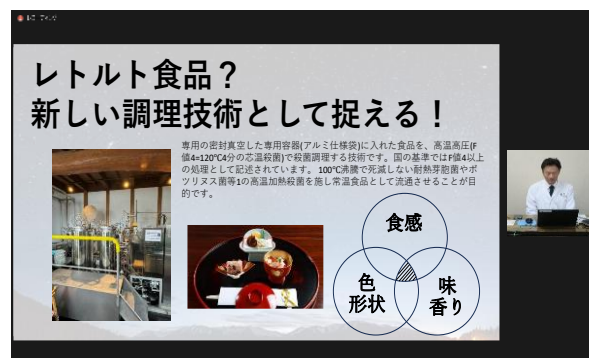
美味しい！がここにある日常から備えておきたい「美蓄食」について