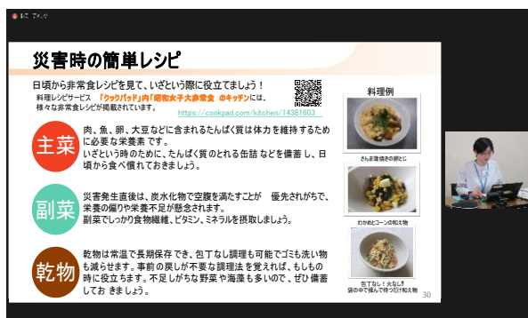
災害時の食料備蓄等)について