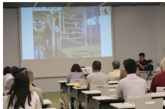
リスクコミュニケーション「食の安全と農林水産物生産の魅力」の様子