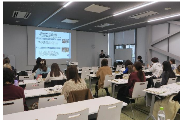
きょうと食の安心・安全ヤングサポーターの養成講座を併催