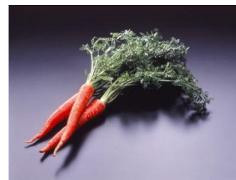
金時にんじん