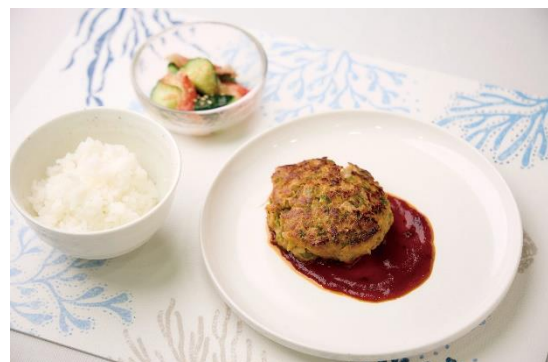
家族で楽しみ、育む満腹レシピ