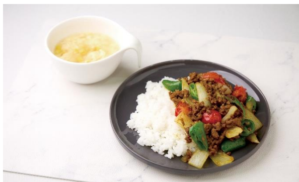
元気に挑戦！万願寺甘とうレシピ

小宮氏考案の「万願寺甘とう」を使った子どもと挑戦できる簡単で美味しいレシピを紹介