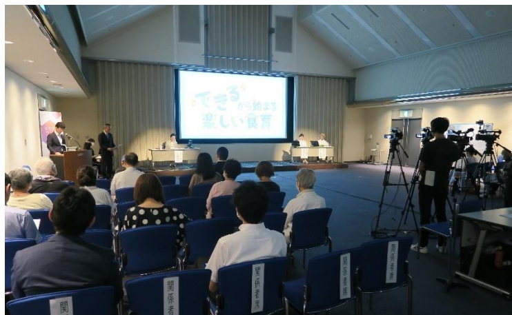
会場の様子（配信動画の収録も実施）

■トークショーアーカイブ（録画）配信 *視聴 URL : https://youtu.be/LXD7DhGfrrtE