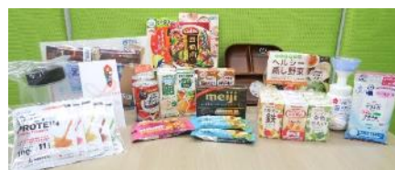
副賞イメージ（写真は第6回最優秀賞のもの）