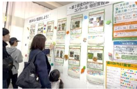
農林水産フェスティバル 2023 における投票の様子

※ 特別賞は事務局で選定した候補作品12点の中から京都府農林水産フェスティバル 2023（令和5年11月25日（土）・26日（日））での来場者投票（総数1,270票）をもとに選考