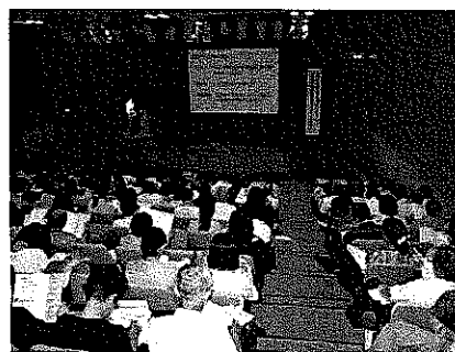
府・市連携して検査状況の報告