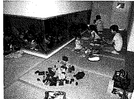
保育ルーム設置で子育て世代の方も参加