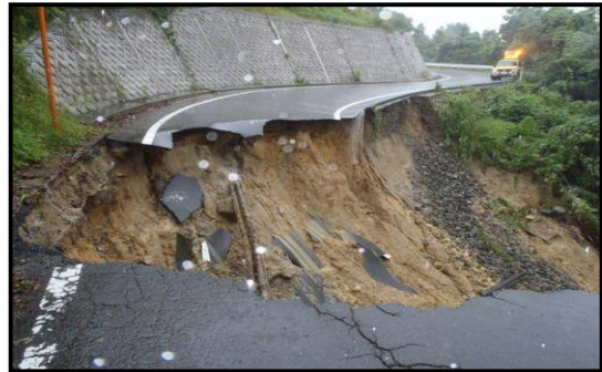
平成 30 年 7 月豪雨 平成 30 年 7 月 6 日～7 月 8 日 (舞鶴宮津線 (宮津市皆原) の路肩欠壊)