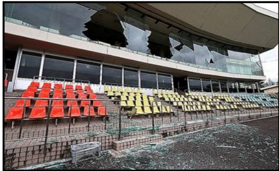
平成 30 年 大阪北部地震 平成 30 年 6 月 18 日 (窓ガラスが破損した京都向日町競輪場 (向日市))