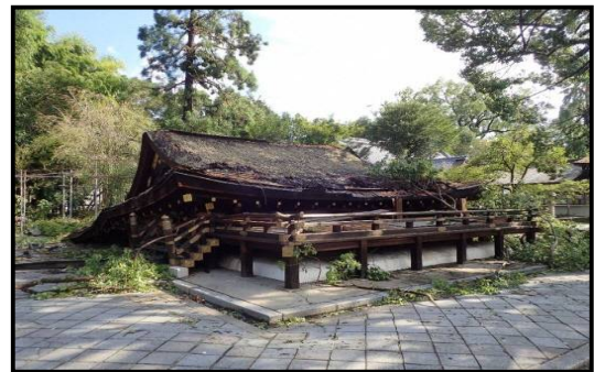
平成 30 年 台風第 21 号 平成 30 年 9 月 4 日 (平野神社拝殿倒壊 (京都市北区、府指定建造物))