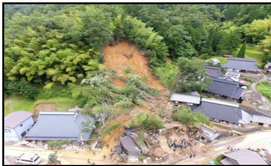
平成 30 年 7 月豪雨 平成 30 年 7 月 6 日～7 月 8 日 (綾部市上杉町の土砂崩れ現場)