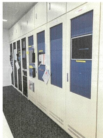
受信機及び防災監視盤のデータを変更予定（中央監視室）