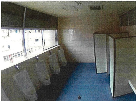
（着工前）男子トイレ