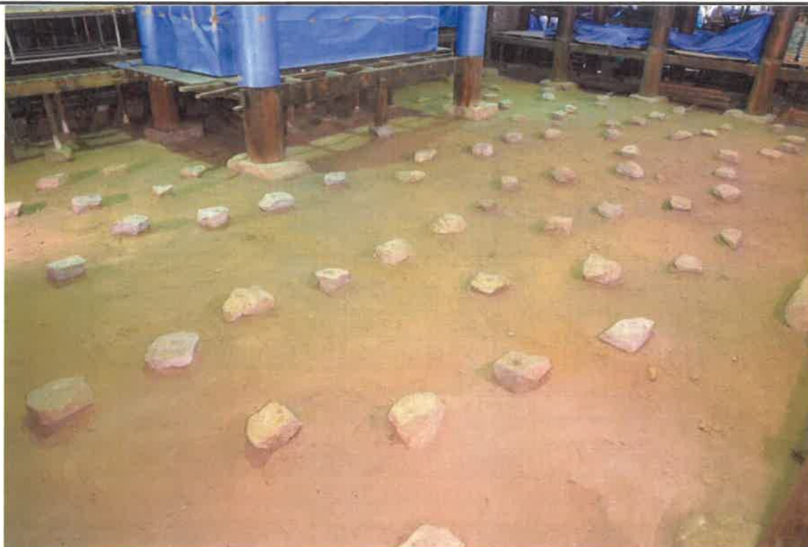
東石 修理前の状況