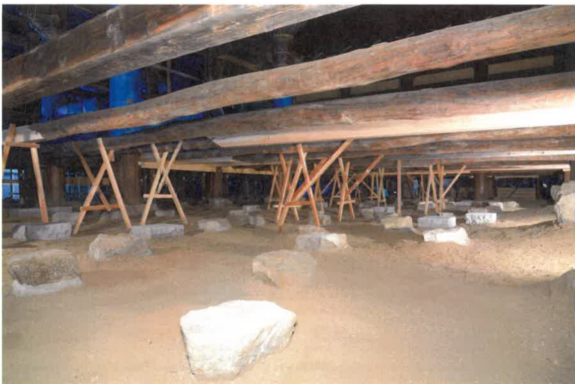
東石固定・据え直し 完了後の状況